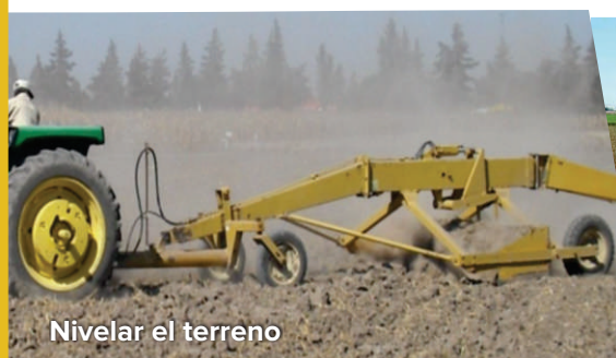
Nivelar el terreno

Algunas de las prácticas de control contra la secadera de trigo son una buena preparación y nivelación del terreno, métodos de siembra, selección de variedades tolerantes, aporques, manejo del agua de riego, fertilización balanceada, rotación de cultivos, entre otros. Además, que se pueden combinar con otras alternativas de control como el uso de productos químicos y biológicos de manera preventiva.