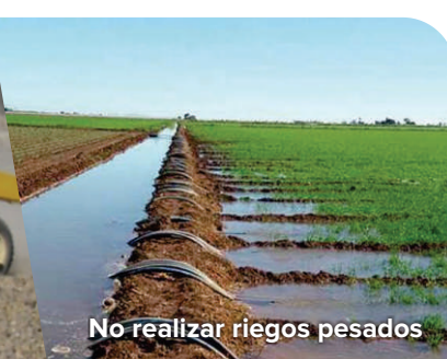
No realizar riegos pesados